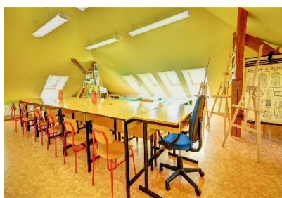
Učebna chemie a fyziky Učebna výtvarné výchovy