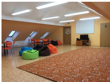
Odpolední družina: 11:25-16:00