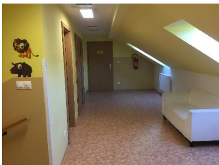
Ranní družina: 6:30-7:20

Nabízíme také školní družinu. Děti v rámci družiny navštěvují kroužky, účastní se různých akcí, které jsou pořádány přímo vychovatelkou školní družiny.